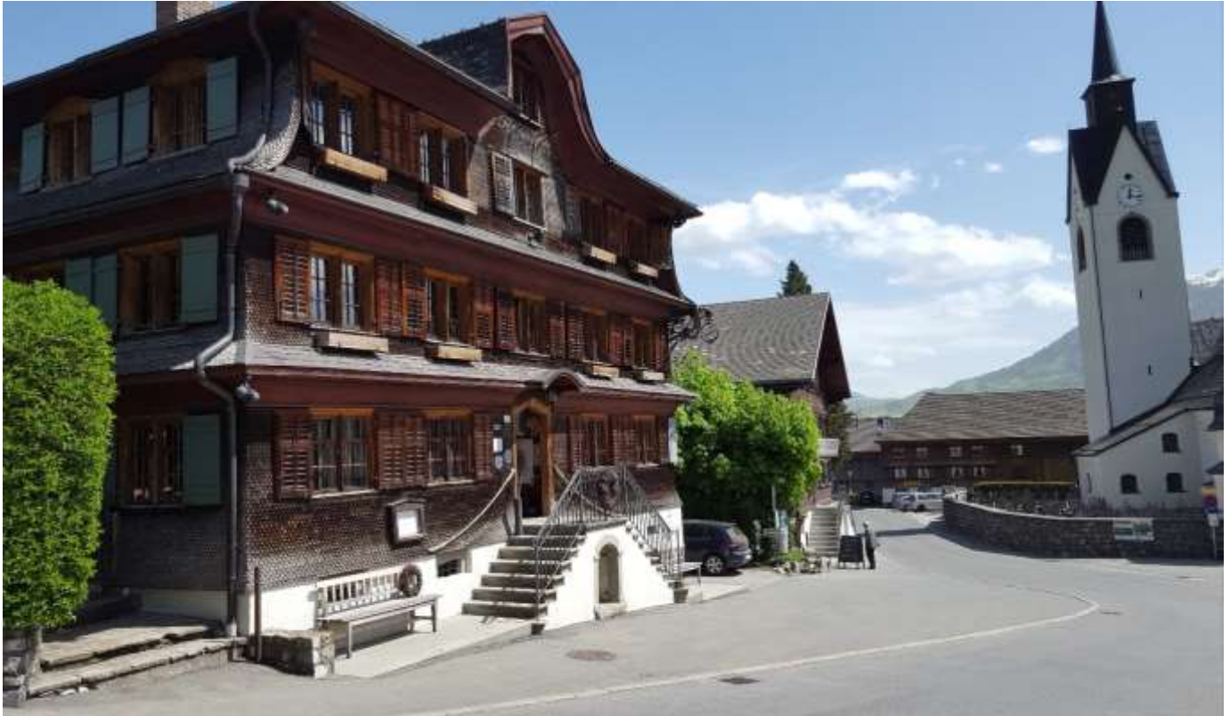
Historisches Gasthaus zum Hirschen mit Mörike-Stube, rechts die Kirche mit Werken von Angelika Kauffmann

Es ist für die Goethe-Gesellschaft Ludwigsburg e.V. obligatorisch, jedes Jahr eine mehrtägige Reise anzubieten. Für 2020 haben wir eine literarisch-musikalische Reise nach Schwarzenberg im Bregenzerwald / Vorarlberg geplant.